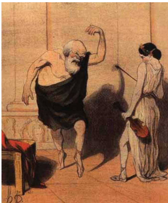
(090) Домье О. Сократ и Аспазия. XIX в.

Все люди стремятся к удовольствиям и их сложным комбинациям, складывающимся в пользу и счастье. Это – непосредственная истина, являющаяся основой человекознания. Она не требует доказательств, как не требует доказательств, например, констатация того, что рыбы живут в воде, а птицы летают. Сказать: люди стремятся к удовольствиям — это все равно что сказать: люди стремятся позитивно утвердить свое бытие. По сути дела, речь идет о том, что человек ведет себя как человек, что он тождественен самому себе. Сократ говорит: "Благо – не что иное, как удовольствие, и зло — не что иное, как страдание" (1, 244). Если учесть, что понятия блага и зла обозначают позитивные и негативные цели деятельности, то мы тем самым получаем строгий закон человеческого поведения, а вместе с ним и критерий его оценки: стремиться к удовольствиям и избегать страданий.